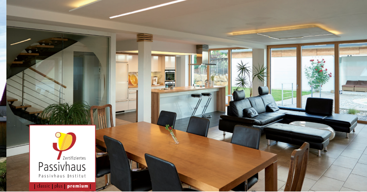
EFH in Halle/Saale | Architekt Johann-C. Fromme | Foto © Jan Wagener