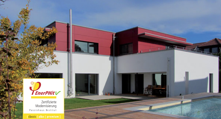
EFH-EnerPHit-Sanierung in Reutlingen | Architekt Rainer Graf