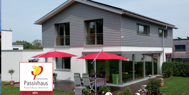
Einfamilien-Passivhaus in Kempten