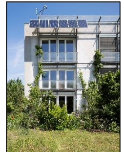
Das weltweit erste Passivhaus in Darmstadt feierte gerade seinen 30. Geburtstag!