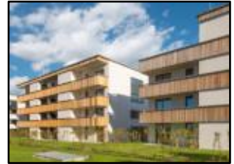
Sozial und hoch energieeffizient: Mehrfamilienhäuser im Passivhaus-Standard.

Kontakt: Katrin Krämer / Pressesprecherin / Passivhaus Institut / www.passiv.de E-Mail: presse@passiv.de // Tel: 06151 / 826 99-25