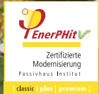
EFH-EnerPHit-Sanierung in Reutlingen | Architekt Rainer Graf