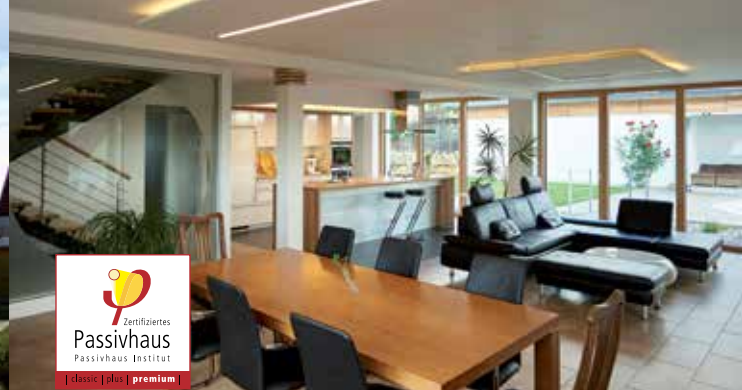
EFH in Halle/Saale | Architekt Johann-C. Fromme | Foto © Jan Wagener